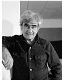
Alberto Burri