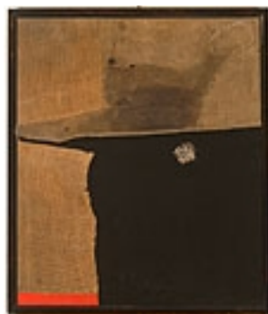
Sacco , 1954

Dopo aver visitato la Villa, apprezzandone l'arredo in stile Impero e la magnifica raccolta di quadri, può sorprendere che il gusto di Luigi Magnani si sia orientato verso l'estetica di Burri, come testimonia l'acquisto del Sacco 53 (1954). Ebbene, è tutto il contrario.